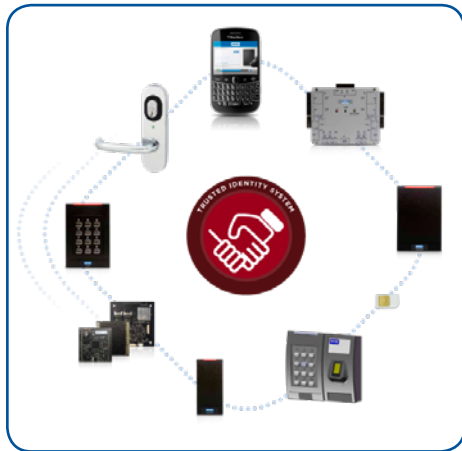
Plataforma iCLASS SE®